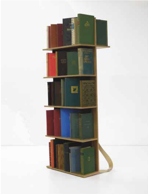
Rucksack der Liebenden / Sac à dos de l'aimante / Backpack of the Lover